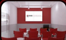
SALA DE GESTÃO DE TALENTOS